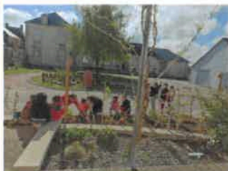
Plantation d'aromatiques et petits fruits par les élèves dans un parterre de la nouvelle cour,

Avec un effectif de 75 enfants l'an prochain, notre RPI est très dynamique. Bravo à ses enseignantes et à ses parents d'élèves toujours prêts à soutenir des projets.