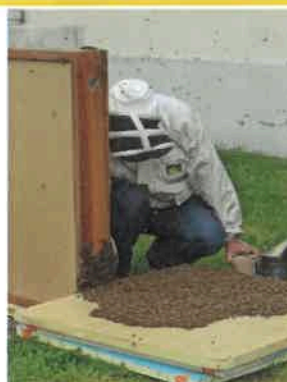
L'essaim d'abeilles a suivi la reine dans l'apiscope

Ainsi l'apiscope (ruche pédagogique) est revenu en classe : l'occasion de questionner le professeur-apiculteur et d'observer l'installation des abeilles.