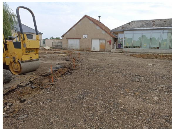
Pendant les travaux cet été,,,

L'entreprise Laumonier conduit ces travaux. Les plantations avec JF de Drevant se feront à l'automne.